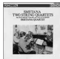
スメタナ:弦楽四重奏曲第1番&第2番のCD(スメタナSQ)

まだまださまざまな例はあると思うけれど、もう十分だろう。この旅を試みて、僕に中には最初「恐れ」があったのだが、それは最後には「勇氣」に変わっていた。彼らは、想像を絶する心の闘いの記録を僕たちに残して世を去った。巨大な困難にはからずも出会ってしまった人間が、それほど感動的なものを生み出すことができるか。彼らの音楽は、僕たちを目もくらむ崖づぶちに立たせながら、その深淵を逃げずに見つめ、すべての人間が心に持っているその深さを受け止めて生きていく力を与えてくれるのだ。