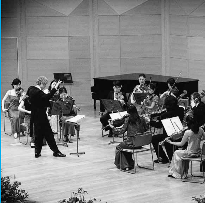
ニュー・イヤー・コンサート2003より